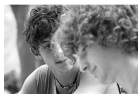
シチリア・サマー(イタリア) 1 月 12 日(金)～1 月 25 日(木)