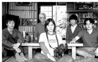
愛にイナズマ(日本) 12 月 29 日(金)～1 月 11 日(木)