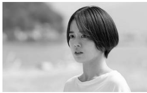
リゾートバイト(日本) 12 月 1 日(金)～12 月 14 日(木)