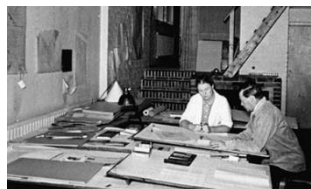
アアルト(フィンランド) 12 月 1 日(金)～12 月 14 日(木)