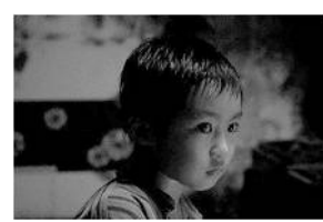
ほかげ(日本) 1 月 5 日(金)～1 月 18 日(木)