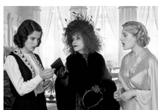
私がやりました(フランス) 12 月 15 日(金)～12 月 28 日(木)