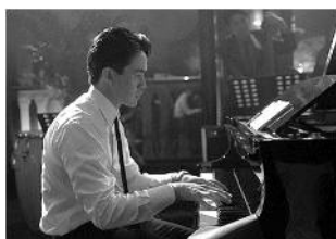
白鍵と黒鍵の間に(日本) 12 月 1 日(金)～12 月 14 日(木)