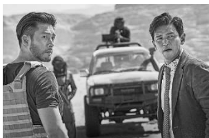
極限境界線 救出までの 18 日間(韓国) 12 月 1 日(金)～12 月 14 日(木)