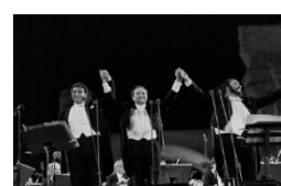
甦る三大テノール 永遠の歌声 (ドイツ) 3月12日(金)~3月25日(木)