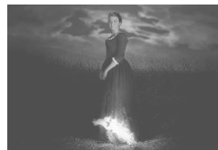
燃ゆる女の肖像 (フランス) 2月5日(金)~2月18日(木)