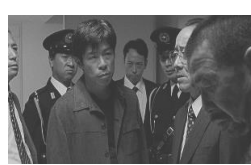
無頼 (日本) 2月19日(金)~3月4日(木)