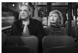
声優夫婦の甘くない生活 (イスラエル) 2月5日(金)~2月18日(木)