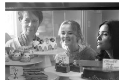
ノッティングヒルの洋菓子店 (イギリス) 2月26日(金)~3月11日(木)