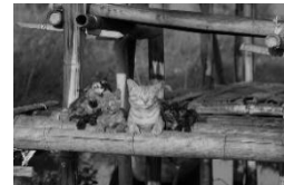
劇場版 岩合光昭の世界ネコ歩き あるがままに、水と大地のネコ家族 (日本) 3月12日(金)~3月25日(木)