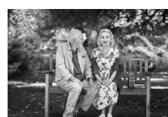
43年後のアイ・ラヴ・ユー (スペイン、アメリカ、フランス+) 3月12日(金)~3月25日(木)