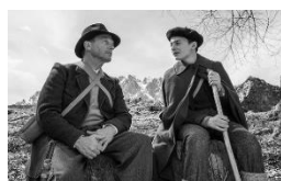
アーニャは、きっと来る (イギリス、ベルギー) 2月5日(金)~2月18日(木)