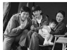
君の誕生日 (韓国) 2月5日(金)~2月18日(木)