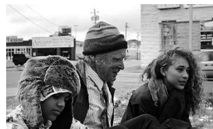
スウィート・シング (アメリカ) 1月14日(金)~1月20日(木)