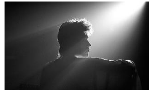
スターダスト (イギリス、カナダ・PG12) 12月3日(金)~12月16日(木)