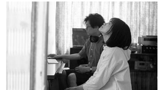
かそけきサンカヨウ (日本) 12月10日(金)~12月23日(木)