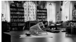
TOVE トーベ (フィンランド、スウェーデン) 12月3日(金)~12月16日(木)