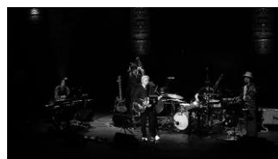
SAYONARA AMERICA (日本) 1月14日(金)~1月27日(木)