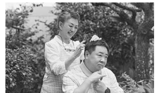
梅切らぬバカ (日本) 1月14日(金)~1月27日(木)