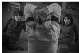
聖地 X(日本) 12月31日(金)~1月13日(木)