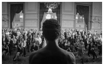
皮膚を売った男 (チェルノブイリ、フランス、ベルギー、スウェーデン、ドイツ、カタール、サウジアラビア) 12月31日(金)~1月13日(木)