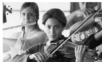
クレッシェンド 音楽の架け橋(ドイツ) 3月18日(金)～3月31日(木)