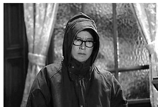
弟とアンドロイドと僕(日本) 2月25日(金)～3月3日(木)