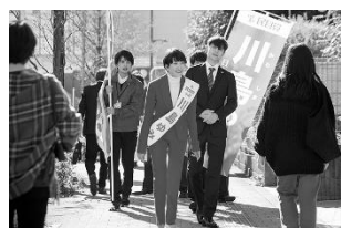
決戦は日曜日(日本) 3月4日(金)～3月17日(木)