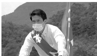
香川1区(日本) 2月11日(金)～2月17日(木)