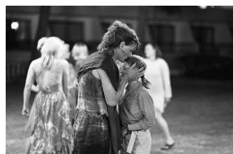
パーフェクト・ノーマル ・ファミリー (デンマーク・PG12) 2月11日(金)～2月17日(木)