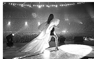
ヴォイス・オブ・ラブ (フランス、カナダ) 2月18日(金)～3月3日(木)