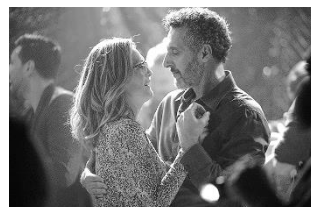
グロリア 永遠の青春 (アメリカ・PG12) 2月11日(金)～2月17日(木)