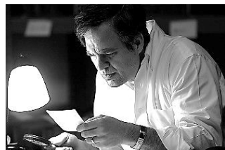
ダーク・ウォーターズ 巨大企業が隠れた男(アメリカ) 2月18日(金)～3月3日(木)