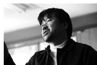
さがす(日本) 3月18日(金)～3月31日(木)